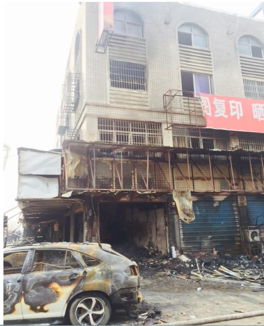
湖南岳阳“1·24”事故现场