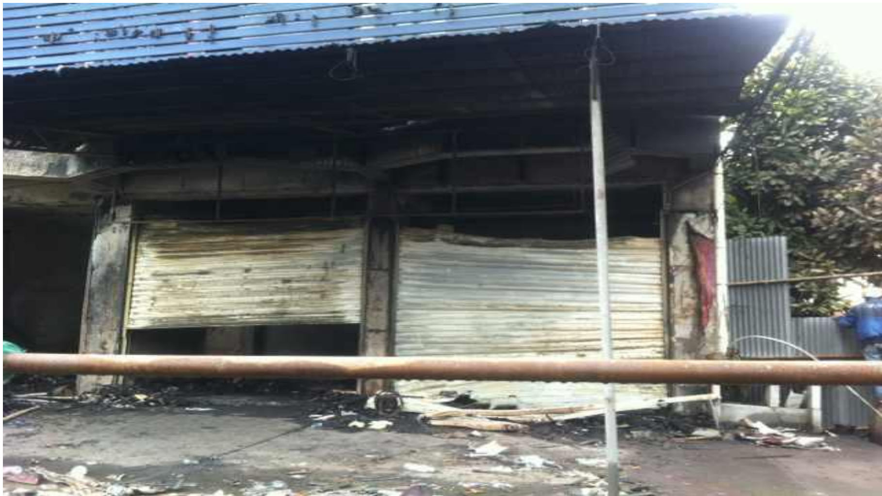
浙江永康“2·19”事故现场