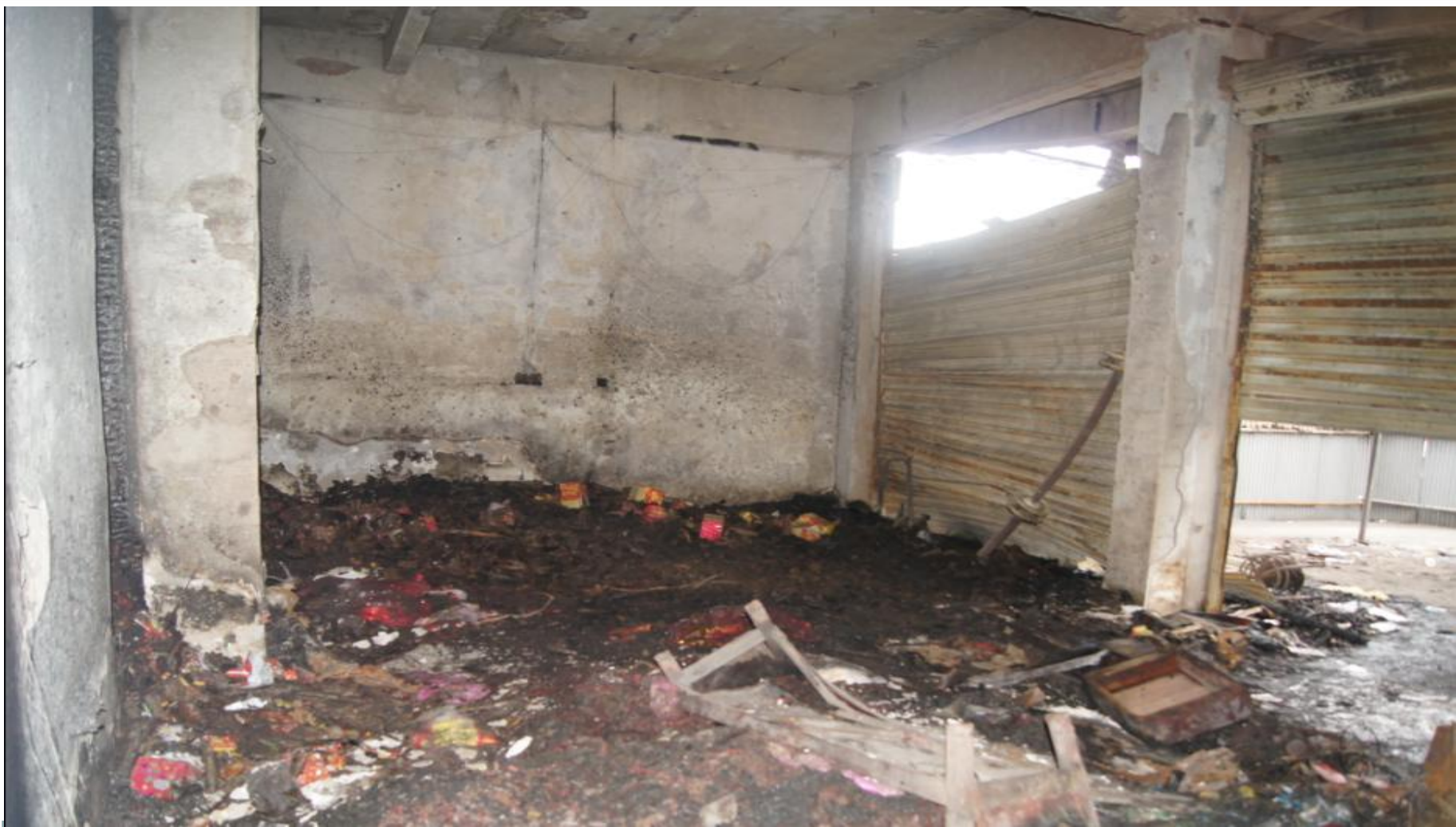
浙江永康“2·19”事故现场：零售点内部