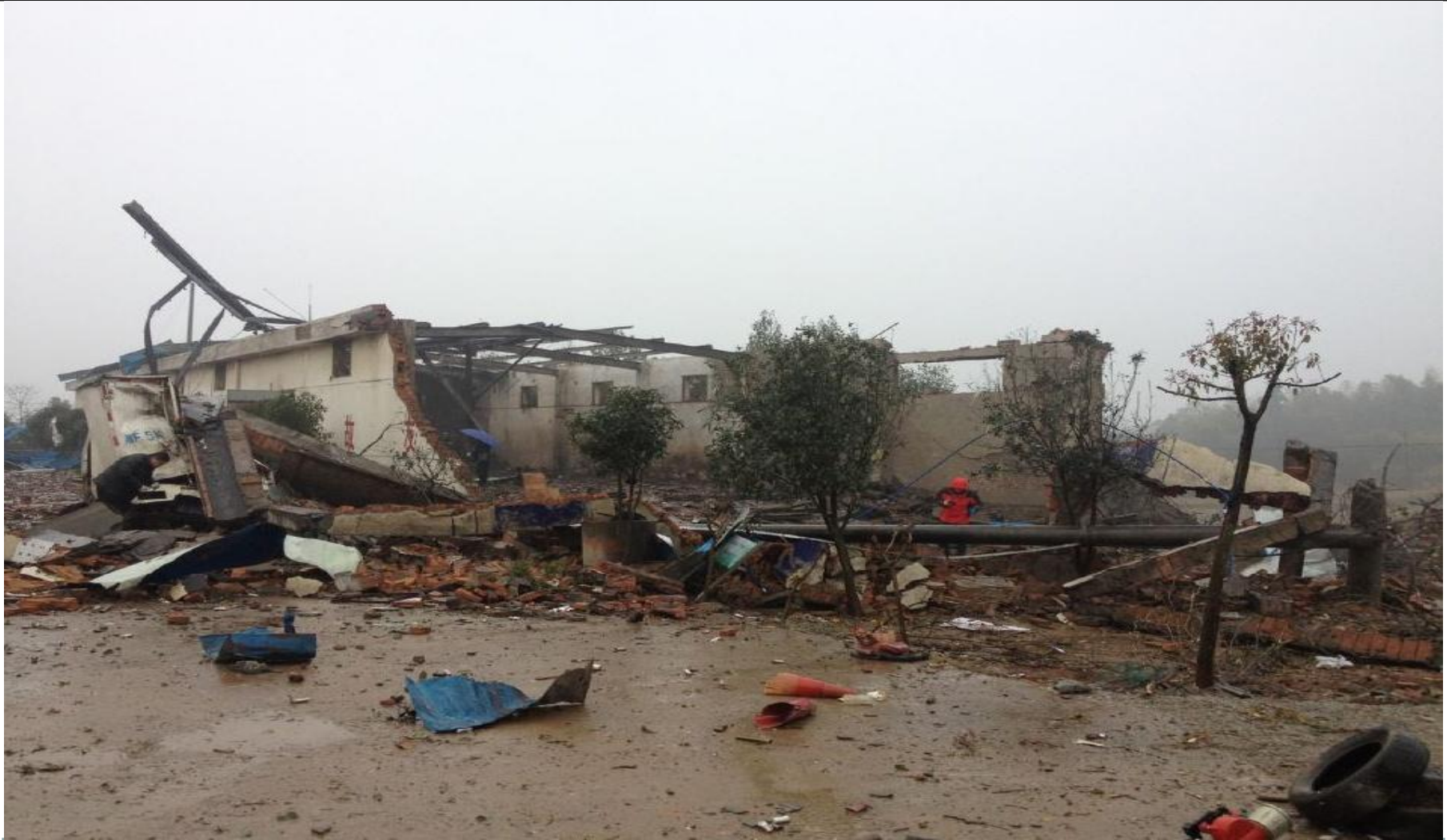
湖南华容“2·25”事故现场