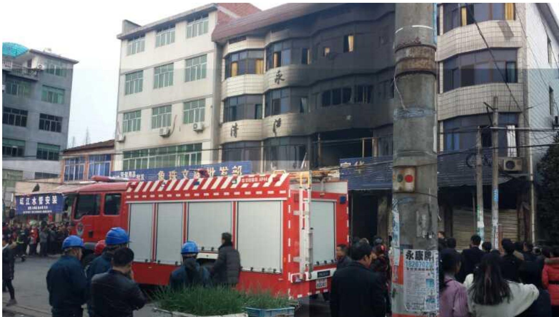
浙江永康“2·19”事故现场：“下店上宅”